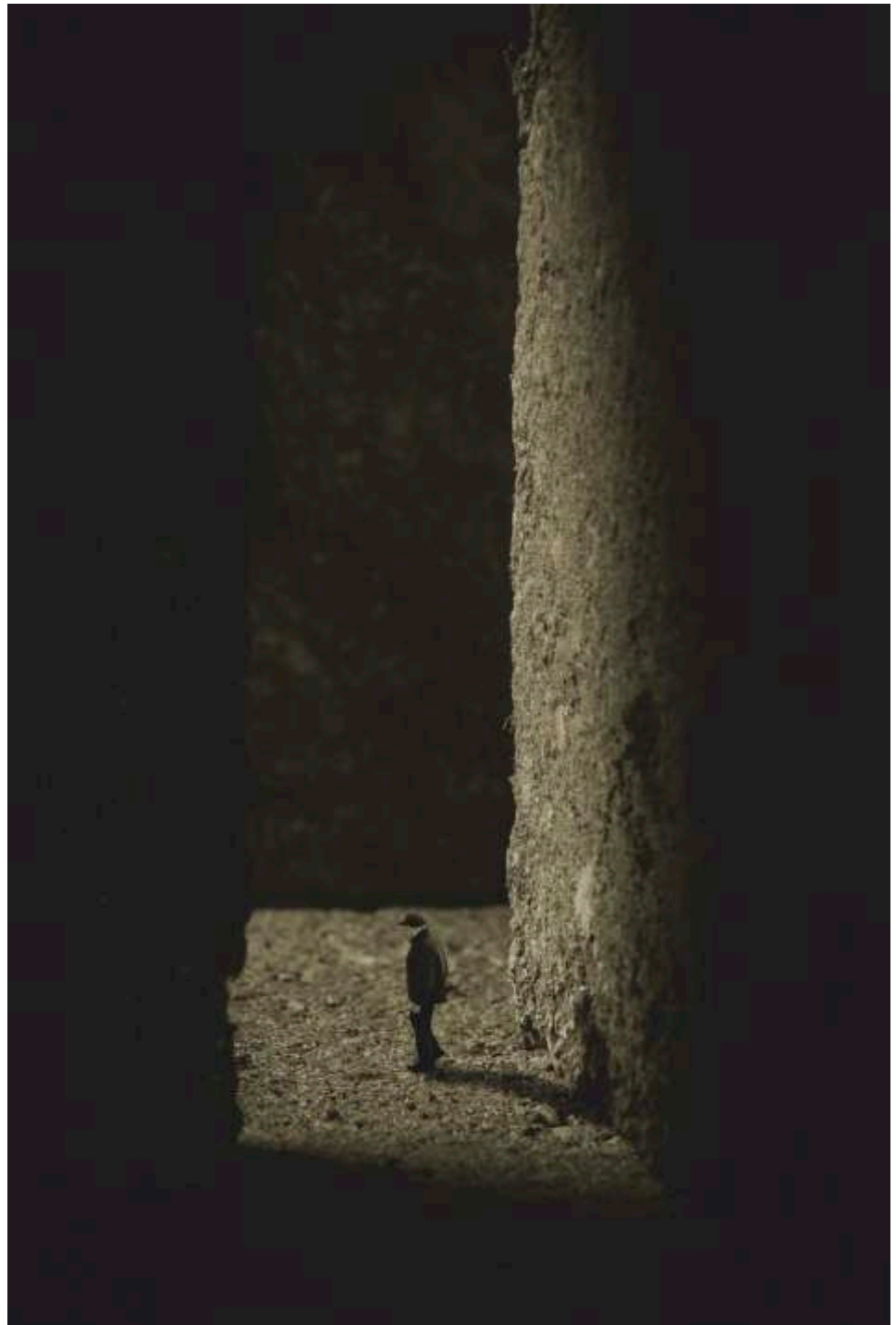
Jerzy Skiba „W labiryncie 1”