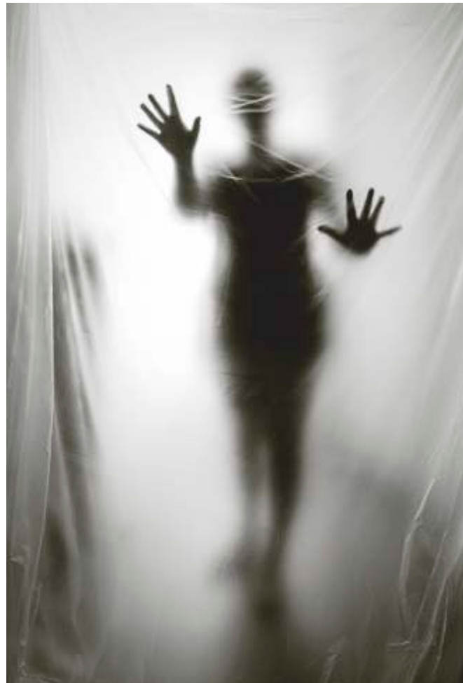
Anna Białowska „Isolation nation 1”