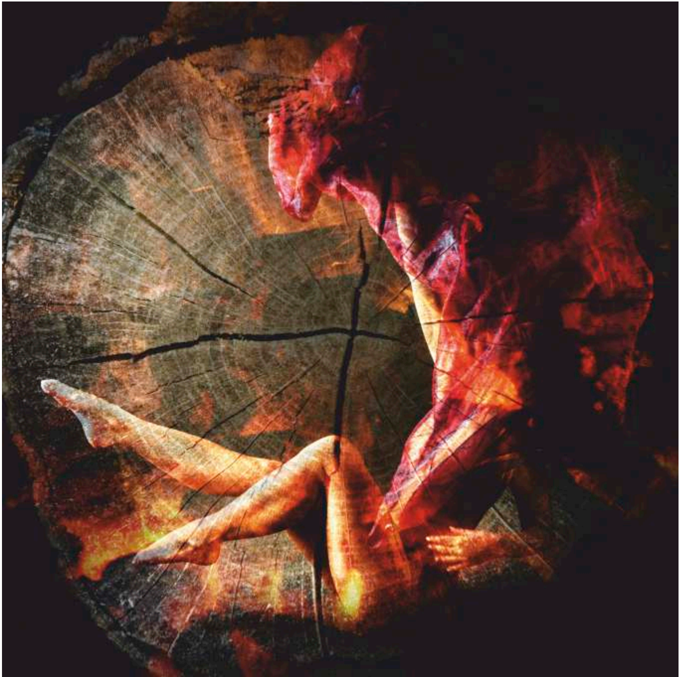
Tomasz Pisarski „Arboretum 2”