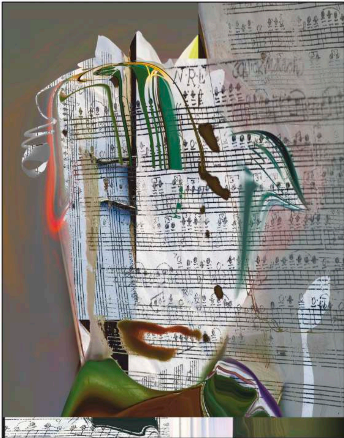
Goutam Chatterjee „Face of suffering 1”