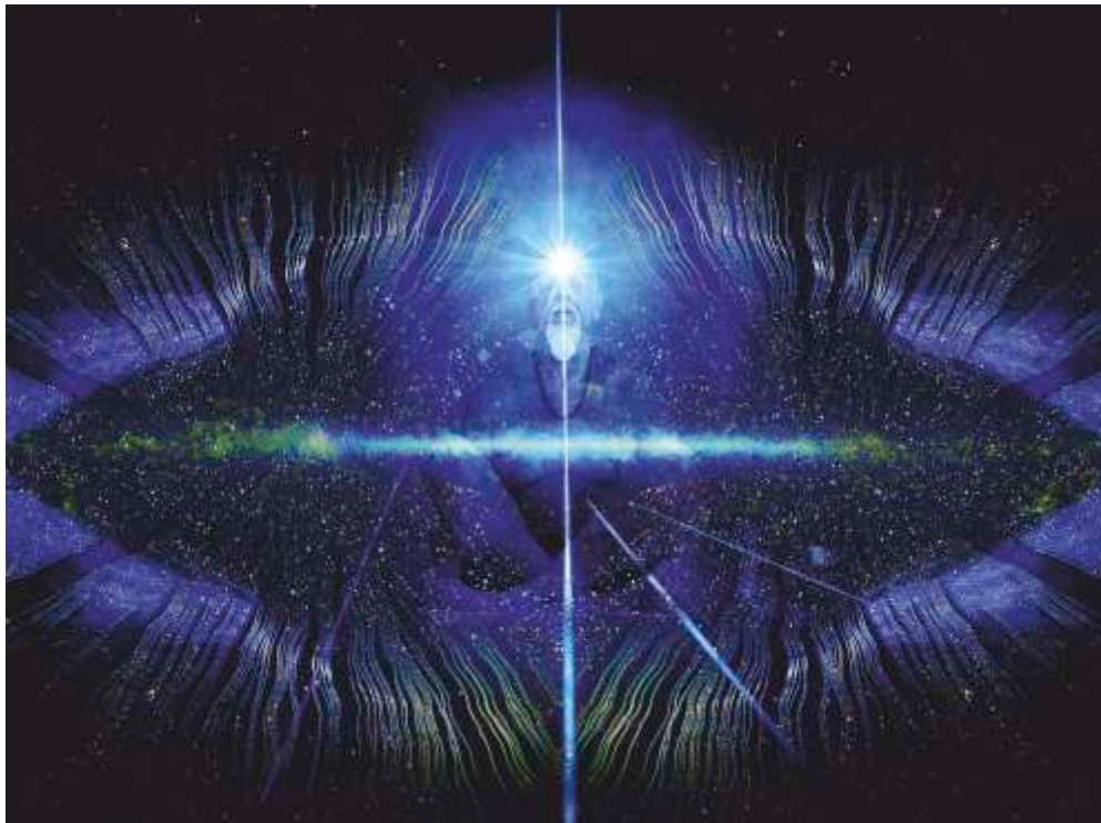
Czesław Chwiszczuk „Medytacja”