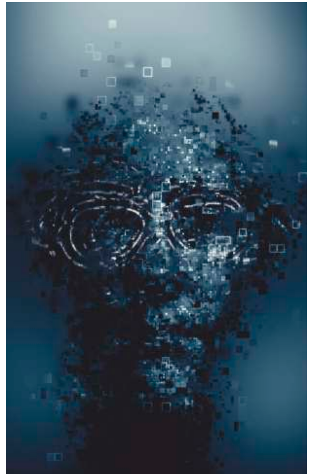
Faruk Ibrahimovi „Decomposition”